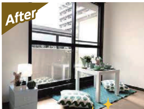
事例② 松山市福音寺町Bマンション 築28年/90戸