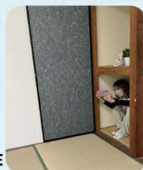
お部屋の魅力を引き出す アングル探し中...