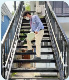
共用部のお掃除中