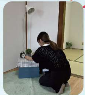
写真映えするよう 小物を配置しています!