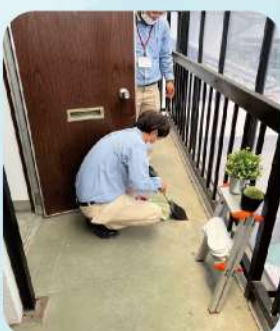
玄関のお掃除も 念入りに!